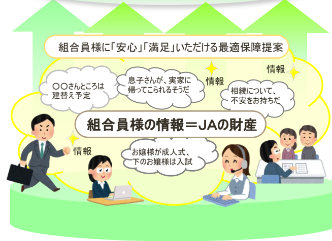
組織で情報を共有・更新・活用